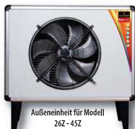
Außeninheit für Modell 26Z - 45Z