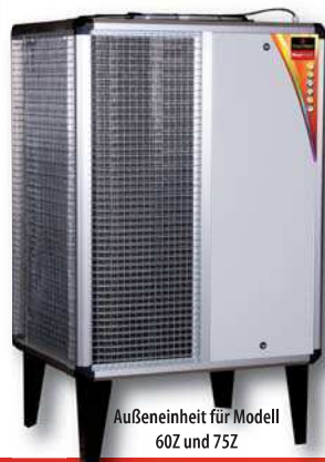
Außeninheit für Modell 26Z und 75Z